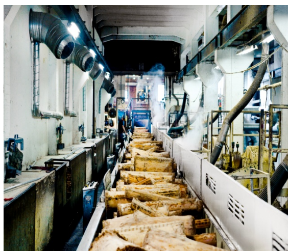
Sliperiet vid Rottneros Bruk