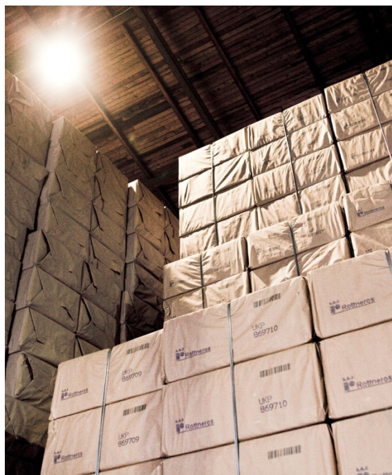
Massalagret vid Vallviks Bruk.