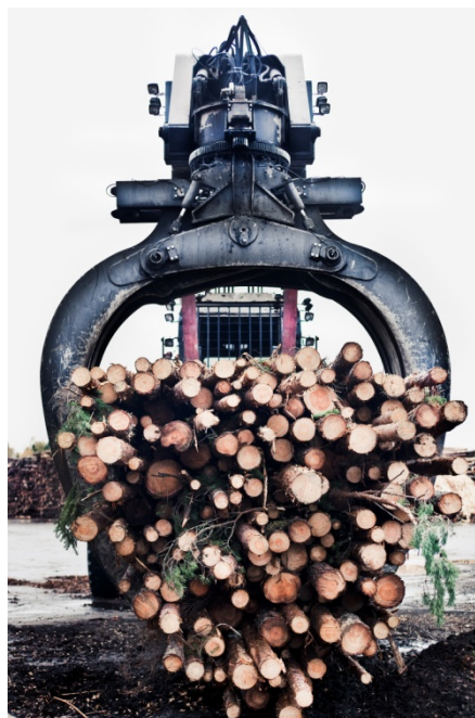
Vedhantering vid Vallviks Bruk.